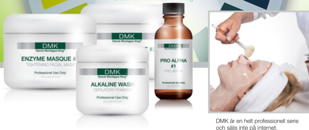
DMK är en helt professionell serie och säljs inte på internet.

Succé för DMK vid The Skin Games - den första tävlingen för proffsen med resultatet i fokus.